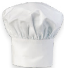
Hotellerie oder Gastronomie

waff KundInnencenter Nordbahnstraße 36 1020 Wien