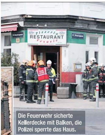
Die Feuerwehr sicherte Kelderdecke mit Balken, die Polizei sperrte das Haus.